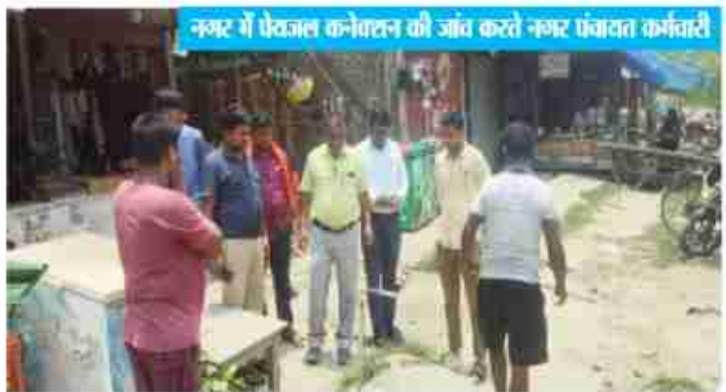
नगर में पेयजल कनेक्शन की जांच करते हुए नगर पंचायत कर्मचारी