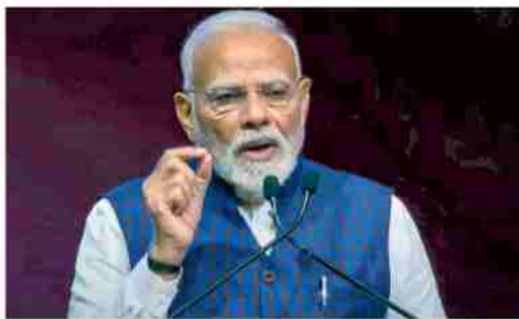
गोवावॉट से अधिक हो गई है। इस उपलब्धि के साथ भारत आज दुनिया

परमाणु वैज्ञानिकों ने एक बहुत बड़ी कामयाबी हासिल की है। तमिलनाडु के कलपक्कम में फ्रस्ट ब्रीडर रिएक्टर ने क्रिटिकैलिटी हासिल कर ली है। पीएम ने गर्व से कहा कि यह भारत की परमाणु ऊर्जा यात्रा में एक बड़ा मील का पत्थर है और सबसे बड़ी बात यह है कि इसे पूरी तरह से भारत की अपनी तकनीक से बनाया गया है। पवन ऊर्जा में दुनिया में भारत का डंका पीएम मोदी ने पवन ऊर्जा को एक ऐसी अदृश्य शक्ति बताया जो देश को आगे ले जा रही है। भारत ने पवन ऊर्जा के क्षेत्र में बड़ी प्रगति की है और अब देश की उत्पादन क्षमता 56