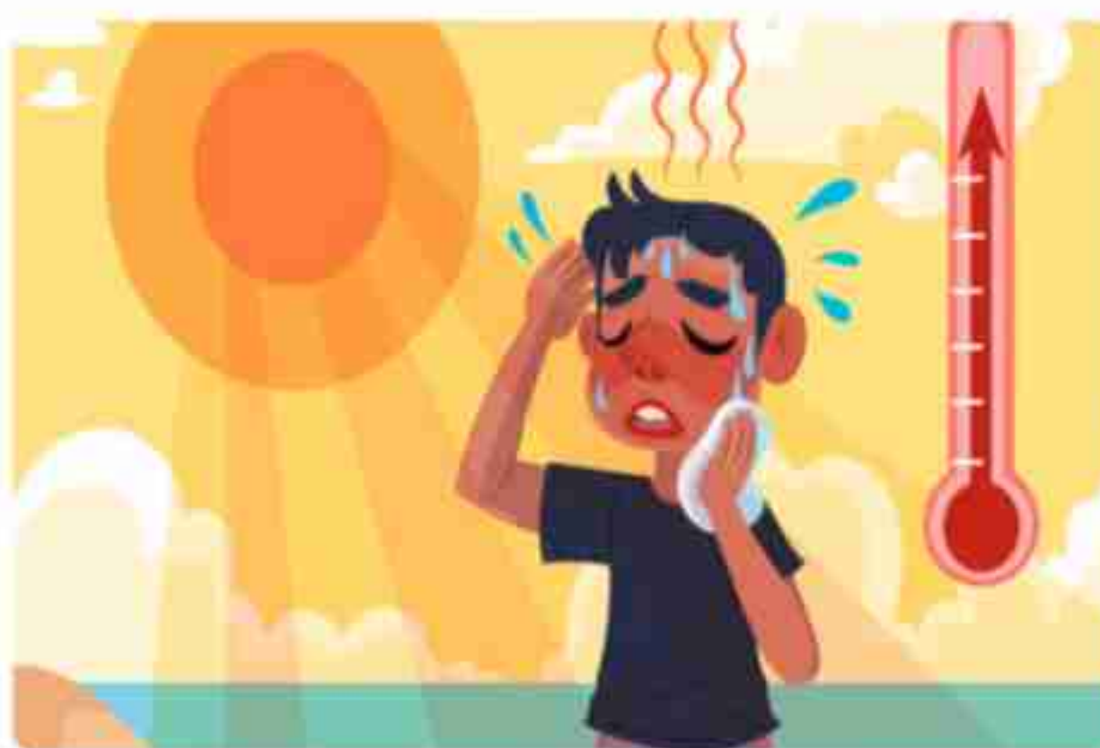
कई राज्यों में अगले दो दिनों तक तेज लू चलने की चेतावनी दी है। तापमान 40 डिग्री

नई दिल्ली । दिल्ली में बढ़ती गर्मी के बीच सरकार ने हीट वेव प्लान में दो बड़े बदलाव किए हैं। अब स्कूलों में बच्चों को लूझी से पहले ओआरएस घोल दिया जाएगा और सार्वजनिक जगहों पर पशु-पक्षियों के लिए पानी की व्यवस्था होगी। दिल्ली में तेज होती गर्मी और लू के खतरे को देखते हुए सरकार ने हीट वेव एक्शन प्लान में अहम बदलाव किए हैं। मुख्यमंत्री रेखा गुप्ता के निर्देश पर अब दिल्ली सरकार के करीब 15 लाख और एमसीडी स्कूलों के लगभग 6 लाख बच्चों को लूझी से पहले ओआरएस घोल पिलाकर घर भेजा जाएगा, ताकि डिहाइड्रेशन से बचाव हो सके। इसके साथ ही जिला प्रशासन और सिविक एजेंसियों को निर्देश दिए गए हैं कि वे पार्कों और सार्वजनिक स्थानों पर पशु-पक्षियों के लिए पीने के पानी की व्यवस्था करें। आज तेज लू चलने की चेतावनी मौसम विभाग ने दिल्ली समेत उत्तर भारत के