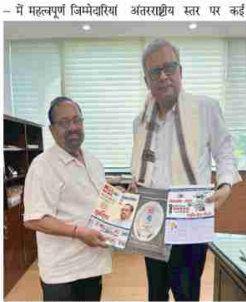
निभाई। उन्होंने राष्ट्रीय और अहम असाइनमेंट्स को सफलतापूर्वक कवर किया। राष्ट्रपति और अन्य वरिष्ठ अधिकारियों के साथ विदेश यात्राओं की रिपोर्टिंग में भी उनकी महत्वपूर्ण भूमिका रही। हिंदी डिजिटल पत्रकारिता को नई दिशा देने में भी उनका विशेष योगदान रहा। बीबीसी हिंदी वेबसाइट के लॉन्च में उनकी अहम भूमिका को पत्रकारिता जगत की बड़ी उपलब्धि माना जाता है।