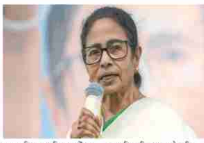
ममता बनर्जी ने चुनाव प्रक्रिया पर गंभीर संकेत देते हुए इसे चुनाव नहीं, बल्कि अत्याचार बताया। उन्होंने राय पुलिस, केंद्रीय बलों और चुनाव आयोग की भूमिका पर भी सवाल खड़े किए।

कोलकाता । पश्चिम बंगाल विधानसभा चुनाव में हार के बाद भी मुख्यमंत्री ममता बनर्जी ने पद छोड़ने से साफ इनकार कर दिया है। उन्होंने स्पष्ट कहा कि वह इस्तीफा नहीं देंगी, अगर किसी को हटाना है तो उन्हें सबूत कर दिया जाए। उनके इस बयान के बाद राय को राजनीति में नया विवाद खड़ा हो गया है। तृणमूल कांग्रेसके सूत्रों के अनुसार, ममता बनर्जी ने पार्टी के नवीनवाचित विधायकों को बैठक में यह बात कही। उन्होंने आरोप