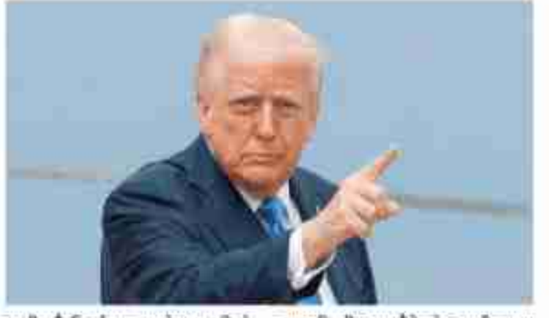
उम्मीद है कि ईरान अपने 48 घंटे के अंतर विधिगत प्रमाणों पर अपने प्रतिक्रिया देगा। हालांकि खबर में यह भी कहा गया है कि अभी कुछ तय नहीं है। खबर में कहा गया है कि युद्ध शुरू होने के बाद से फोर्सी बार दोनों

इंटरनेशनल डेस्क । अमेरिका के राष्ट्रपति डोनाल्ड ट्रंप ने होर्मुज जलडमरूमध्य नहीं खोलने की स्थिति में ईरान पर और यादा बमबारी करने की बुधवार को चेतावनी दी। इस बीच, युद्ध खत्म करने के लिए दोनों देशों के समझौते के करीब पहुंचने की खबर भी सामने आई है। अमेरिकी पॉलिटिक्स एंथोनिस एन्थोनिस को खबर में अमेरिकी अधिकारियों और दो अन्य सूत्रों के हवाले से कहा गया है कि अमेरिका और ईरान युद्ध खत्म करने को लेकर एक छूट के समझौते पर काम कर रहे हैं। हालांकि खबर में यह भी कहा गया है कि अभी कुछ तय नहीं है। खबर में कहा गया है कि युद्ध शुरू होने के बाद से फोर्सी बार दोनों