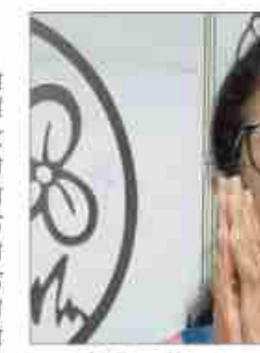
नाम हटाने की राजनीति स्वीकार नहीं है। ममता बनर्जी ने बिना नाम लिए केंद्रीय गृह मंत्री अमित शह पर निशाना साधते हुए आरोप लगाया कि राय में मतदाताओं के नाम हटाने के पीछे उनकी मुफ्तगी है। उन्होंने चुनौती देते हुए कहा, अगर हिम्मत है तो सोंपे मुकाबला करें।

पश्चिम बंगाल की मुख्यमंत्री ममता बनर्जी ने रिकवार को चुनावी सभा में मतदाताओं से अपील की कि वे वोट के जरिए बदल देने की अपील की है। उन्होंने आरोप लगाया कि विशेष गहन पुरोधण (एसआइआर) के दौरान वोट लोगों के नाम मतदाता सूची से हटा दिए गए हैं। इसके अलावा उन्होंने धनबाद में एक 'ली' में अपनी कार्यकर्ताओं से इंवेपम की निगमनी करने के लिए कहा है। रिकवार को समरोरण में आरोपित रेली को संबोधित करते हुए तुष्णमूल काग्रिस प्रमुख ने कहा कि जिन लोगों के नाम सूची से हटे हैं, वे ट्रेड्यून में अपील करें और मतदान के जरिए इसका जखब दें। उन्होंने कहा, ऐसा बोट करें कि नतीजे हों बात दें कि