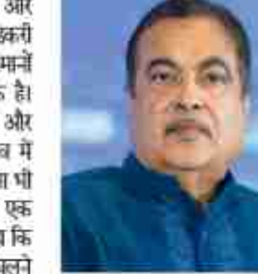
राज्यों की मतगणना चार मई को होगी। उन्होंने कहा कि पार्टी की रणनीति का मुख्य आधार विकास और सुरासन है। उन्होंने बताया कि पूर्वोत्तर क्षेत्र में करीब पांच लाख करोड़ रुपये की परियोजनाएँ चलई जा रही हैं। इनमें से बढ़ई संख्या में काम पूरे हो चुके हैं और कई परियोजनाएँ मिगणोपीन हैं। गडकरी के मुताबिक सड़क, रचनाएँ और लॉजिस्टिक्स से जुड़े ये प्रोजेक्ट बेर

नई दिल्ली । केंद्रीय मंत्री और भाजपा के वरिष्ठ नेता नितिन गडकरी ने कहा है कि उनकी पार्टी मुसलमानों के नहीं, घुसपैठियों के खिलाफ है। इसी के साथ उन्होंने असम और पश्चिम बंगाल विधानसभा चुनाव में पार्टी के बेहतर प्रदर्शन का भरोसा भी जताया। पीटीआई को दिए एक इंटरव्यू में नितिन गडकरी ने कहा कि भाजपा सभी को साथ लेकर चलने की नीति पर काम करती है, चाहे उनका धर्म कुछ भी हो। उन्होंने दोहराया कि पार्टी का विरोध केवल अंधे घुसपैठ के खिलाफ है। गडकरी ने कहा कि उन्हें पूरा विश्वास है कि भाजपा असम और पश्चिम बंगाल दोनों राज्यों में जीत हासिल करेगी। असम में नौ अप्रैल को मतदान होगा है, जबकि पश्चिम बंगाल में 23 और 29 अप्रैल को दो चरणों में वोटिंग होगी। सभी पांच चुनावों