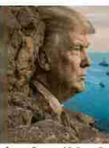
तेल अरबी । अमेरिकी राष्ट्रपति डोनाल्ड ट्रम्प ने ईरान को बार्स्टर्ड कहा है। उन्होंने ईरान को धमकी दी है कि यदि ईरान होर्मुज जलमार्ग को बंद करेगा तो उसे नरक बना दूंगा। ट्रम्प ने कहा कि ईरान को बार्स्टर्ड कहा है। उन्होंने ईरान को धमकी दी है कि यदि ईरान होर्मुज जलमार्ग को बंद करेगा तो उसे नरक बना दूंगा।

हो रहा है और ऐसा नहीं होने पर ईरान के ऊर्जा उद्योगों को निशाना बनकर नरक कर दिया जाएगा। रूस बोला- अमेरिका को अल्टीमेटम की बजाय बातचीत करनी चाहिए। रूस ने अमेरिका से अल्टीमेटम की भाषा खेड़कर बातचीत के रमते पर लौटने को अपील की है। रूस के विदेश मंत्रालय के अनुसार, विदेश मंत्री सर्गेई लॉवरोव ने ईरान के विदेश मंत्री अब्बास अरगन को से फोन पर बातचीत में यह बात कही। लॉवरोव ने उम्मीद जताई कि युद्ध को कम करने की कोशिशें सफल होंगी। उन्होंने कहा कि अमेरिका अगर अल्टीमेटम देने की बजाय बातचीत का रास्ता अपनाए, तो खतना सम्भव हो सकता है। रूस और ईरान दोनों ने इस बात पर जोर दिया कि ऐसे किसी भी कदम से बचना चाहिए, खासकर संयुक्त राष्ट्र सुरक्षा परिषद में, जो कूटनीतिक समाधान की बची हुई संभावनाओं को कमजोर कर सकता है। दोनों देशों ने माना कि मौजूदा संकट का हल राजनीतिक और कूटनीतिक प्रयासों से ही भेजना है और इसके लिए तनाव कम करना जरूरी है।