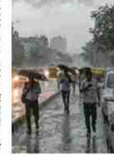
राजस्थान में चलनेगी धूल भरी आंधी

बर्फबारी की चेतावनी दी गई है। इस दौरान 30-60 किमी/घंटा की रफार से हवाएं चल सकती हैं। एक भयंकर पश्चिमी विक्षोभ राजस्थान, दिल्ली एससीआर, हरियाणा, उत्तराखंड पंजाब, जम्मू, हिमाचल, पश्चिम यूपी, बिहार, झारखंड, उत्तर मध्य प्रदेश और पूर्वोत्तर भारत में 7-9 अप्रैल से बढ़े पैमाने पर ओलावृष्टि लाने की उम्मीद है। यह शक्तिशाली सिस्टम भारत के 30-40 फीसदी क्षेत्र को प्रभावित करेगा। दिल्ली-पुनसीआर में बारिश तो