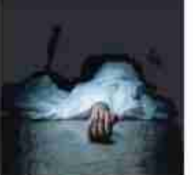
रांची । झारखंड के धनबाद जिले में रिकवार तड़के एक दर्दनाक हदसा हुआ, जहाँ गैस लीक होने से तीन लोगों की मौत हो गई। पुलिस के अनुसार यह घटना कश्चित तौर पर कबाड़ चोरी के दौरान हुई, जिससे इलाके में ससमनी फैल गई। पुलिस ने बताया कि यह घटना धनबाद के मुनीडीह इलाके में रिकवार तड़के करीब 1 बजे हुई। घटना के बाद इलाके में हड़कप पच गया और पुलिस मौके पर पहुंचकर जांच में जुट गई। मुनीडीह