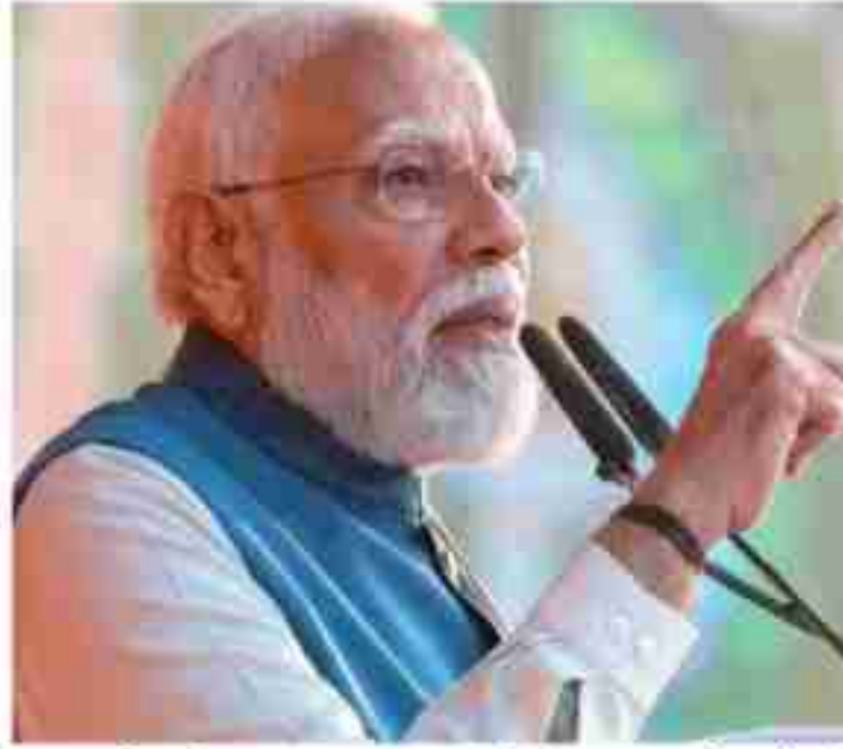
हूप काह कि इनके पाप का घड़ा भर चुका है। पीएम ने कहा, बंगाल की निर्भय सरकार हर रोज लोकतंत्र की हत्या कर रही है। मालदा में

मालदा । प्रधानमंत्री नरेंद्र मोदी ने पश्चिम बंगाल विधानसभा चुनाव से पहले ममता बनर्जी सरकार पर तीखा हमला बोला। पीएम ने मालदा में न्यायिक अधिकारियों को बंधक बनाए जाने की घटना का जिक्र करते हुए इसे लोकतंत्र की हत्या करार दिया। पीएम ने कहा कि बंगाल में जंगलराज है, जहाँ तुष्णमूल काग्रिस ने पीएम मोदी के आरोपों पर पलटवार किया। टीएमसी ने पीएम के आरोपों को फाड़ डालते हुए बीजेपी शासित राज्यों में अपराध के अंकड़े जारी कर दिए। पीएम मोदी का वार- 4 मई के बाद होगा 'वाई-वाई' का हिस्सा। प्रधानमंत्री ने कुचिबिहार की घाटी से ममता सरकार पर निशाना साधा है।